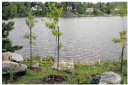
Renaturation de la rive sur la rue de la Promenade-du-lac.

Deux projets de renaturation de la rive ont été réalisés par la Municipalité de Rawdon en mai dernier. Le premier projet a été réalisé au lac Pontbriand, sur une portion de la rive située sur la rue de la Promenade-du-Lac.