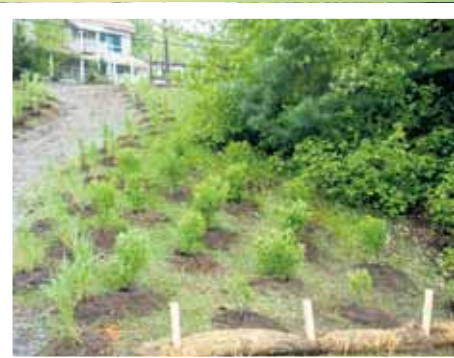
Le deuxième projet a été réalisé au lac Rawdon, sur la rive située près du barrage (sur la 3 e Avenue)

Ces rives serviront de modèles pour les riverains qui doivent redonner un aspect naturel aux rives artificielles.