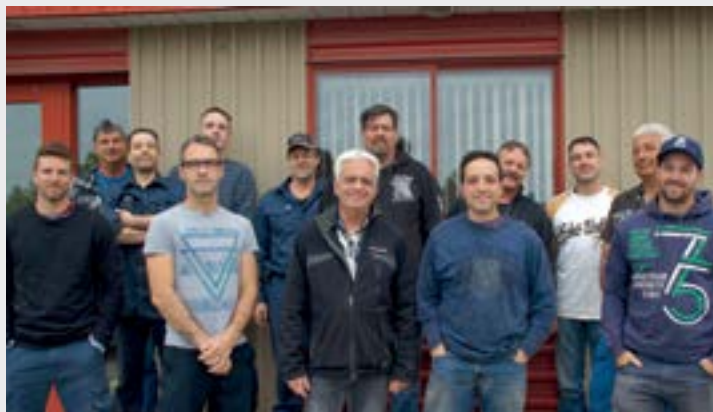
LES MEMBRES DE L'ÉQUIPE

Avec les nombreux projets de voirie, nous leur souhaitons une bonne saison estivale!