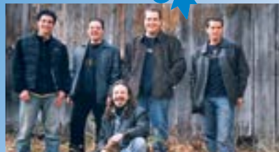
La Vesse du Loup