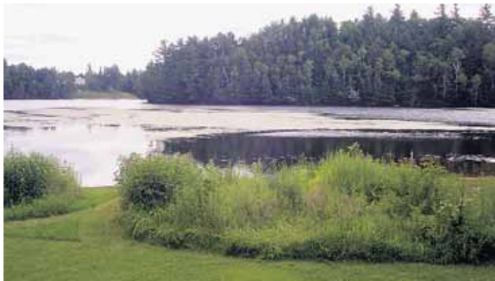
Exemple à suivre : une rive où la végétation reprend place dans les 10 premiers mètres.