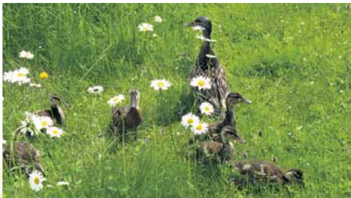
Photo d'une famille de canards prise sur une rive en renaturalisation, lors du passage de l'«Escouade verte».